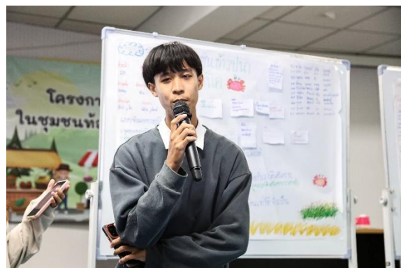
ภาพ : การนำเสนอแผนการจำลองประกอบการ SME โครงการพลวัต SME ไทย ในชุมชนท้องถิ่นกับแผนปฏิบัติการ ประจำปี ๒๕๖๙ ธุรกิจที่ ๕ “ข้าวปูนออแกนิก” ปลูกข้าวปลอดสารเคมี