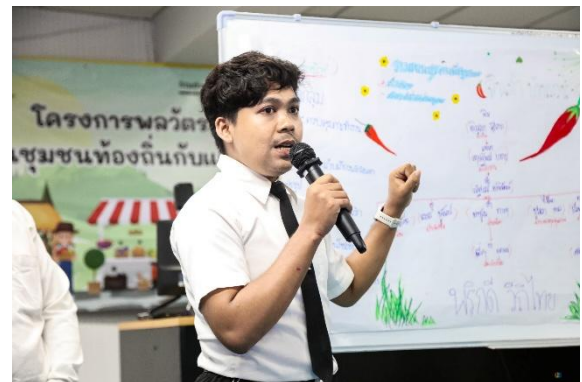
ภาพ : การนำเสนอแผนการจำลองประกอบการ SME โครงการพลวัต SME ไทย ในชุมชนท้องถิ่นกับ แผนปฏิบัติการ ประจำปี ๒๕๖๙ ธุรกิจที่ ๓ “พริกดี วิถีไทย” ผลิตภัณฑ์แปรรูปที่เกี่ยวกับพริก