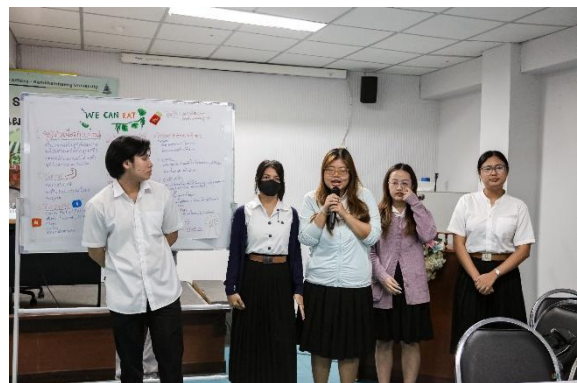
ภาพ : การนำเสนอแผนการจำลองประกอบการ SME โครงการพลวัต SME ไทย ในชุมชนท้องถิ่นกับ แผนปฏิบัติการ ประจำปี ๒๕๖๙ ธุรกิจที่ ๑ “WE CAN EAT” เหมเป้ เพื่อสุขภาพ