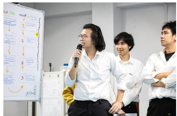
ภาพ : การนำเสนอแผนการจำลองประกอบการ SME โครงการพลวัต SME ไทย ในชุมชนท้องถิ่นกับ แผนปฏิบัติการ ประจำปี ๒๕๖๙ ธุรกิจที่ ๒ “To Your Table” ฝึกชุมชนสู่ออนไลน์