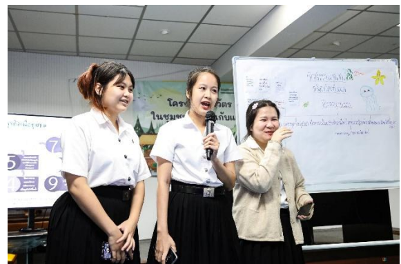
ภาพ : การนำเสนอแผนการจำลองประกอบการ SME โครงการพลวัต SME ไทย ในชุมชนท้องถิ่นกับ แผนปฏิบัติการ ประจำปี ๒๕๖๙ ธุรกิจที่ ๔ “รักษ์ทะเลชุมชน” ผลิตภัณฑ์แปรรูปของทะเล